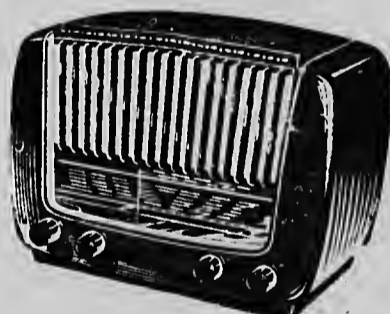
Model BX 416 A uit de